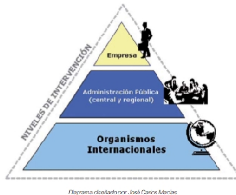
Figura 1. Niveles de Intervención

Para cada uno de estos tres niveles, se han contemplado los pilares o dimensiones sobre los que se apoya la sostenibilidad (Figura 2): aspectos socio-territoriales, económicos y ambientales, estando la gobernanza presente en todas ellas. La clave de la sostenibilidad y de una gestión sostenible, se basa en el equilibrio entre estos tres pilares (Passet, 1997).